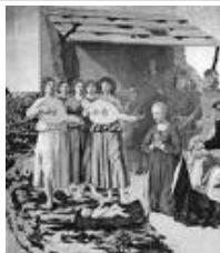
Natività Piero della Francesca (Londra, National Gallery)