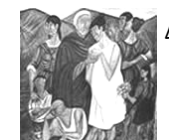
La partenza dell'emigrante— Giuseppe Migneco