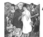
La partenza dell'emigrante - Giuseppe Migneco