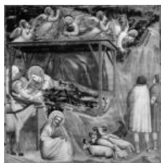
Giotto - NATIVITA' Cappella degli Scrovegni Padova