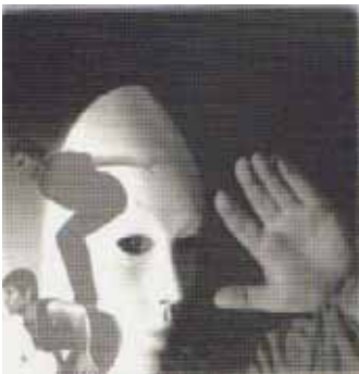
Il nostro punto di partenza.