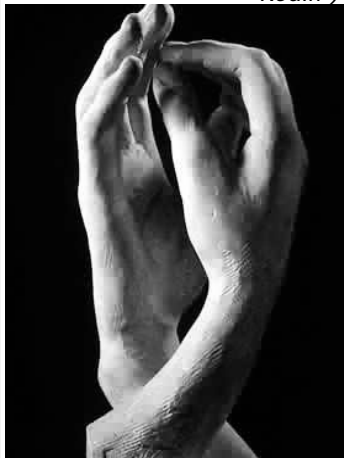
"Cattedrale" - Auguste Rodin